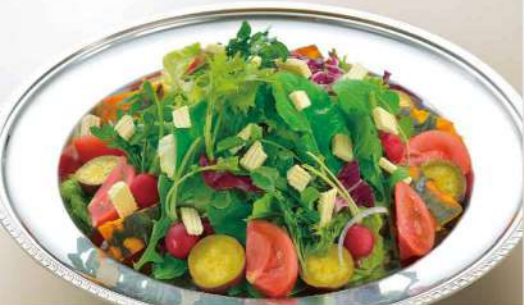
16S18 (直径 40.5cm) グリーンサラダ 4,800円(税込5,184円)