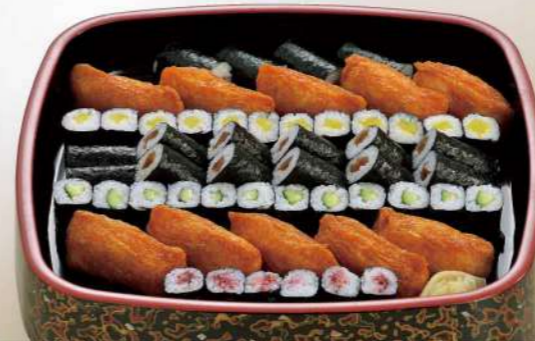
16S04 (34.5×39cm) いなり細巻寿司 3,650円(税込3,942円)