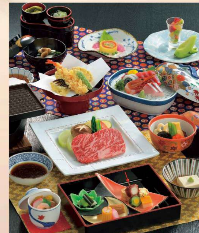
16G03 会席料理「花」 10,500円(税込11,340円)