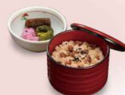
16F12 赤飯(香の物付) 550円(税込594円) 16F13 赤飯ジャー1kg 1,750円(税込1,890円)