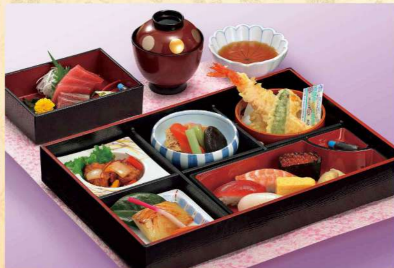
16C01 (26.5×36cm) 寿司松花堂・松 4,500円(税込4,860円)