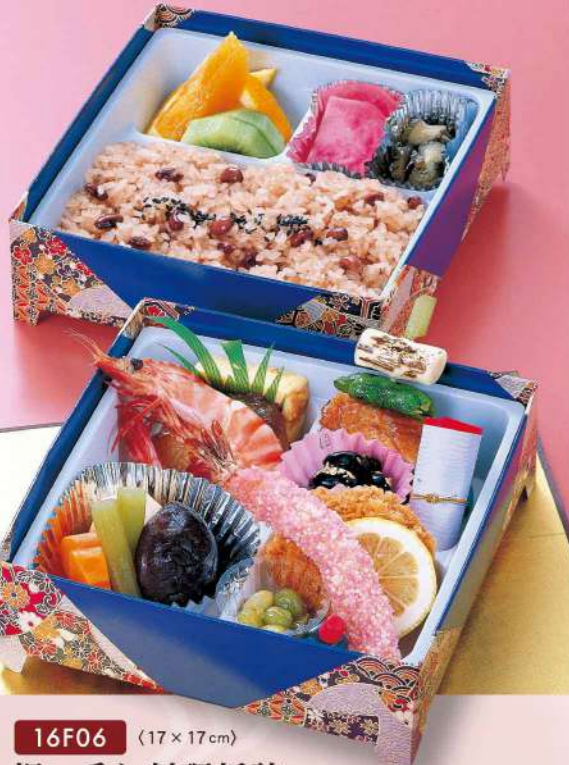
16F06 (17×17cm) 祝い重ね料理折詰 2,700円(税込2,916円)