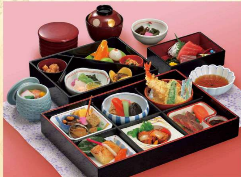
16A03 (26.5×36cm) 松花堂・梅 6,200円(税込6,696円)