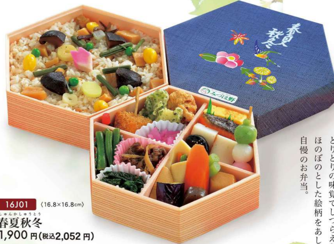
16J01 (16.8×16.8cm) しゅんかしゅうとう 春夏秋冬 1,900円(税込2,052円)

行楽やお出かけのお供に、色々な行事のお食事に、 思い出作りにふさわしいバラエティー豊かなお弁当に、 糸をつむぐように仕立てた味のつづれ織。