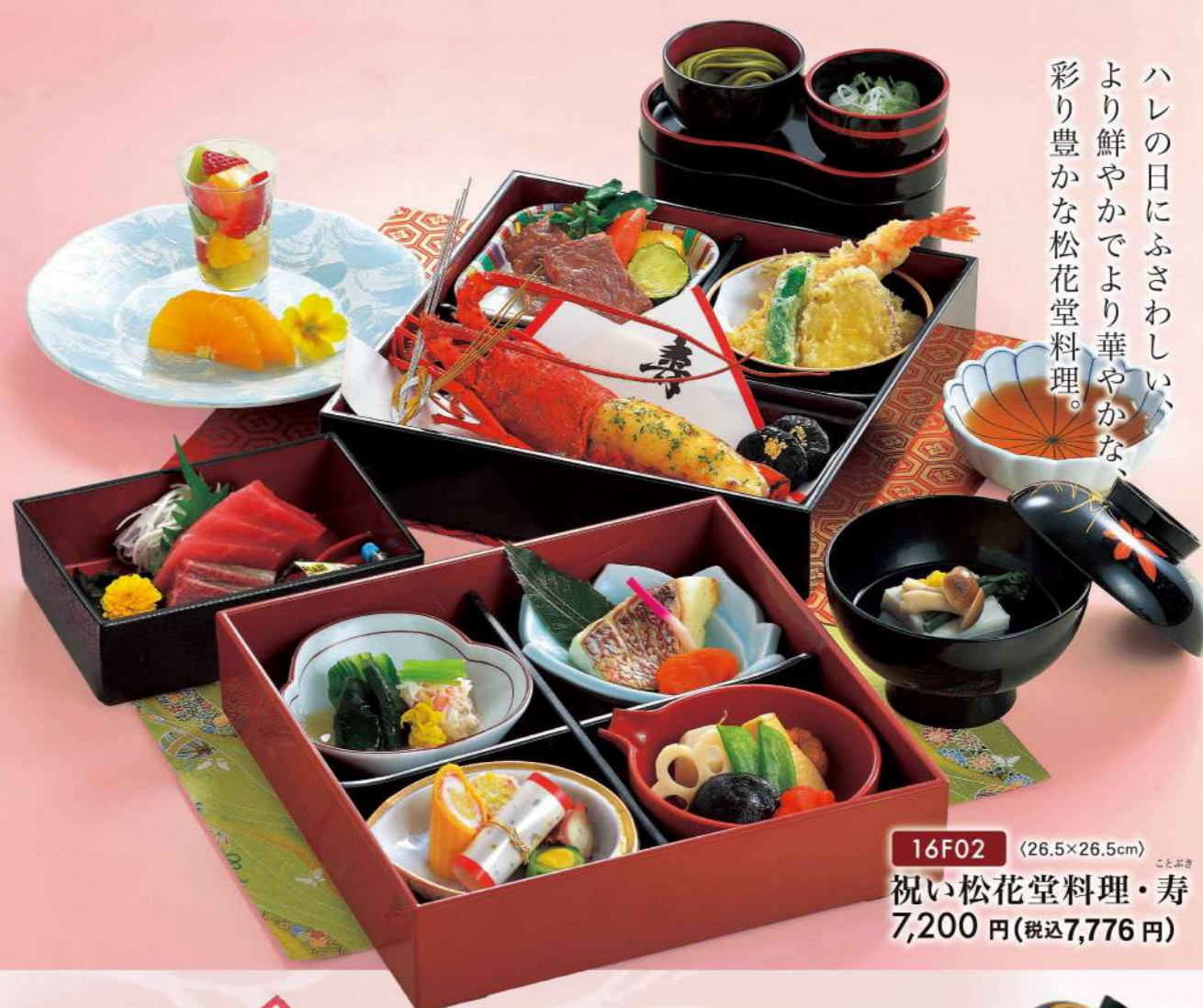
16F02 (26.5×26.5cm) こまぶき 祝い松花堂料理・寿 7,200円(税込7,776円)