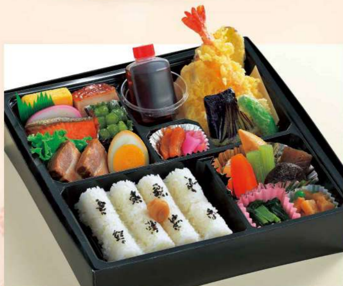
16K01 (26×26cm) 幕の内弁当・松 2,400円(税込2,592円)