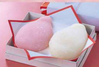
16F15 鶴の子(箱入り) 700円(税込756円)