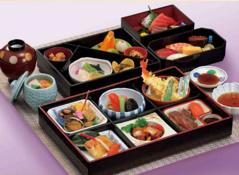
16C03 (26.5×36cm) 寿司松花堂・梅 6,700円(税込7,236円)