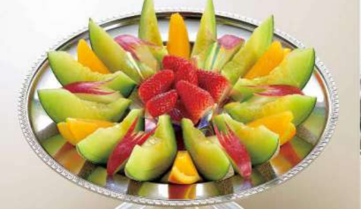
16S23 (直径 40.5cm) 季節のフルーツ 6,500円(税込7,020円)