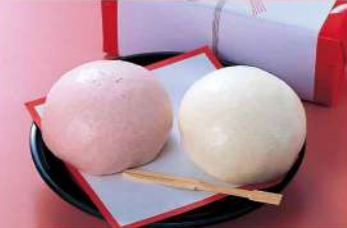
16F14 紅白まんじゅう(箱入り) 600円(税込648円)