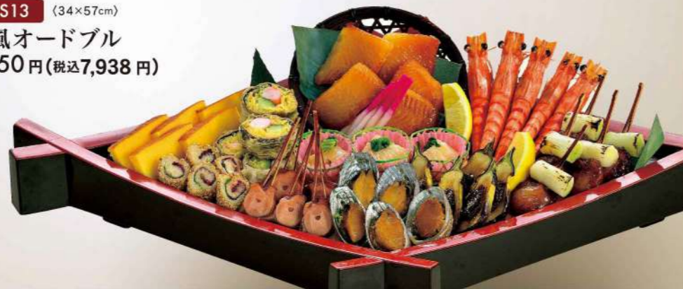
16S13 (34×57cm) 和風オードブル 7,350円(税込7,938円)