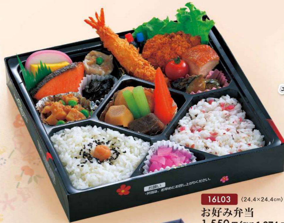
16L03 (24.4×24.4cm) お好み弁当 1,550円(税込1,674円)