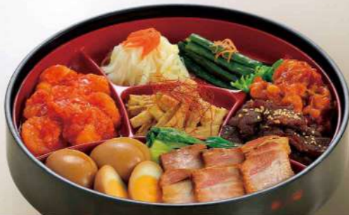
16S11 (直径 28cm) 中華オードブル 6,600円(税込7,128円)