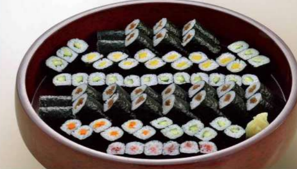
16S03 (直径 36cm) 細巻寿司 3,650円(税込3,942円)