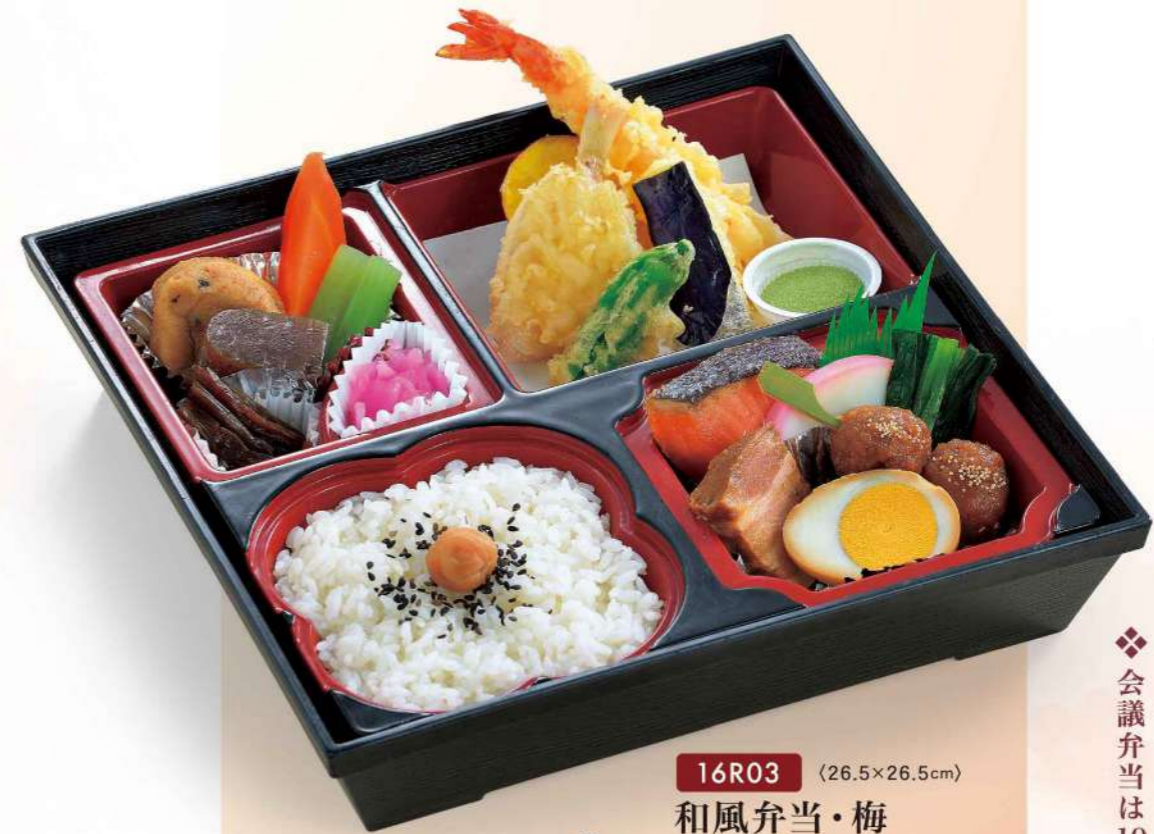
16R03 (26.5×26.5cm) 和風弁当・梅 1,550円(税込1,674円)