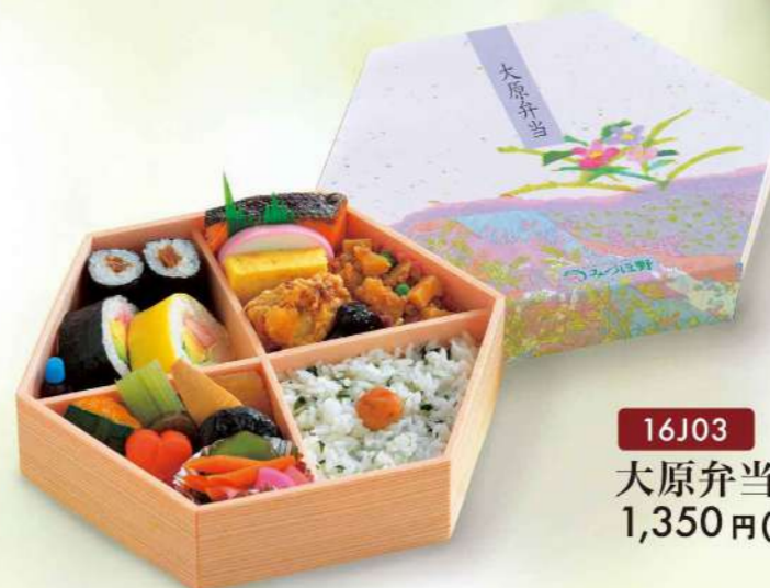
16J03 (21×21cm) 大原弁当 1,350円(税込1,458円)