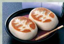
16Z39 春日まんじゅう(箱入り) 600円(税込648円)