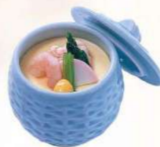
16T04 茶碗蒸し 450円(税込486円)