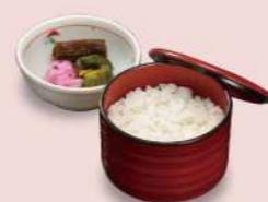
16T01 白飯(香の物付) 400円(税込432円) 16T02 白飯ジャー1kg 1,150円(税込1,242円)