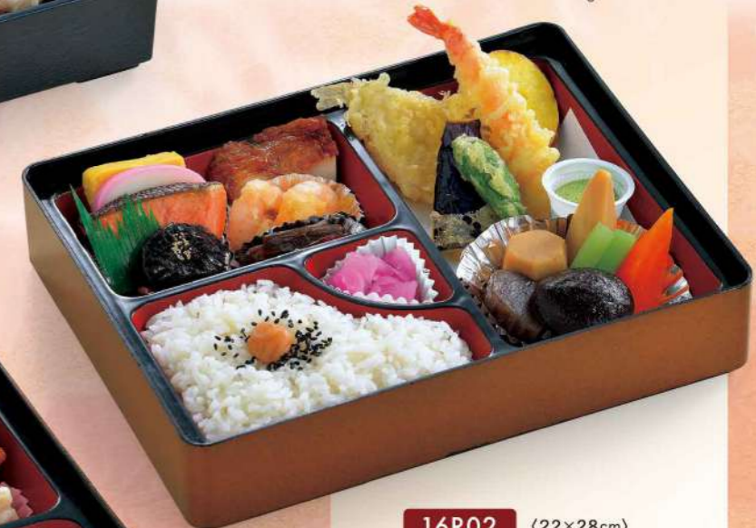
16R02 (22×28cm) 和風弁当・竹 1,350円(税込1,458円)