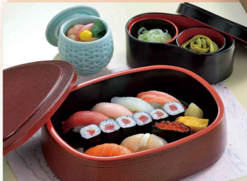
16R08 (18.5×24cm) 江戸前にぎり寿司・竹 2,050円(税込2,214円)