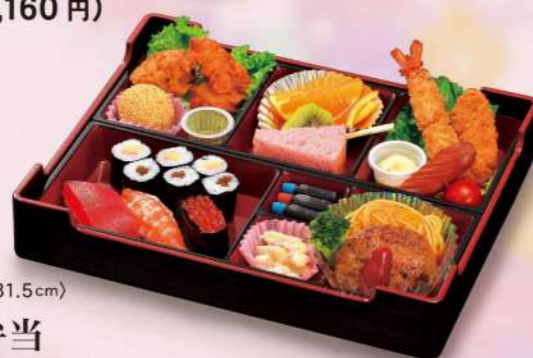
16Y01 (25.5×31.5cm) お子様寿司弁当 3,500円(税込3,780円)