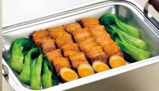
16S08 (28.5×40cm) 豚肉角煮 5,750円(税込6,210円)