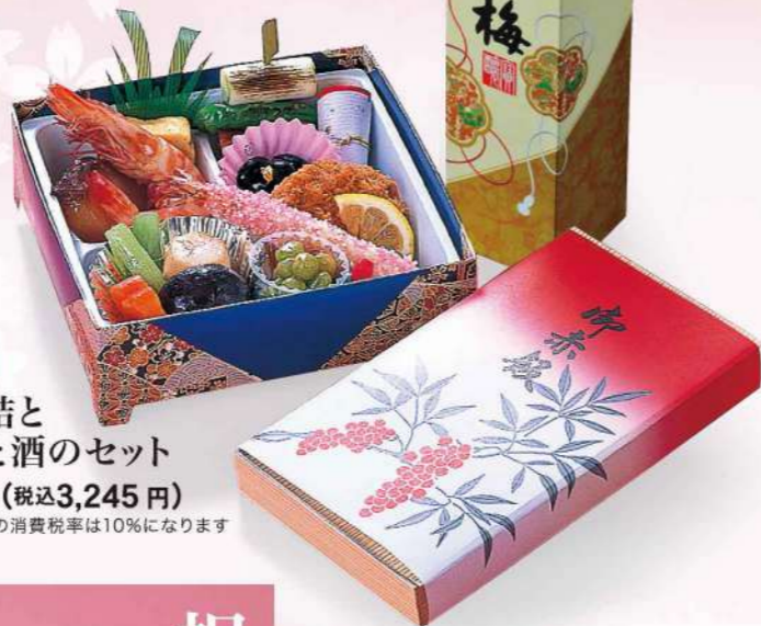
16F05 料理折詰と 赤飯折と酒のセット 2,950円(税込3,245円) ※アルコール類の消費税率は10%になります