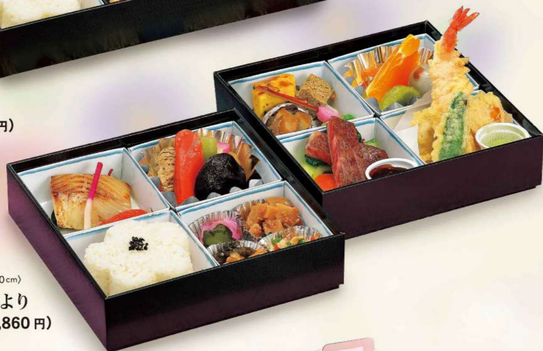
16H01 (20×20cm) 四季弁当・ひより 4,500円(税込4,860円)