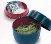
16T03 茶そば 550円(税込594円)