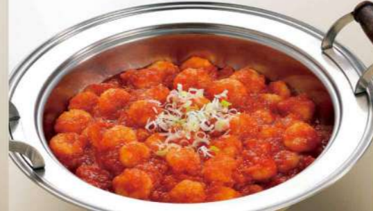
16S10 (直径 40.5cm) 海老チリソース 6,100円(税込6,588円)