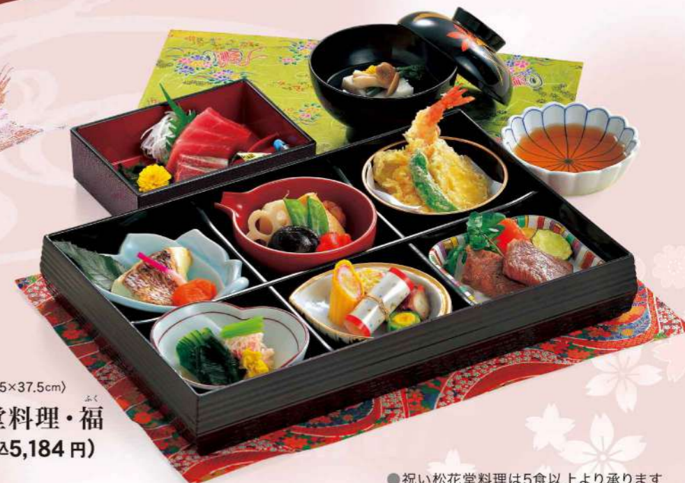
16F01 (25.5×37.5cm) ふく 祝い松花堂料理・福 4,800円(税込5,184円)