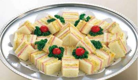
16S19 (直径 40.5cm) サンドイッチ 3,900円(税込4,212円)