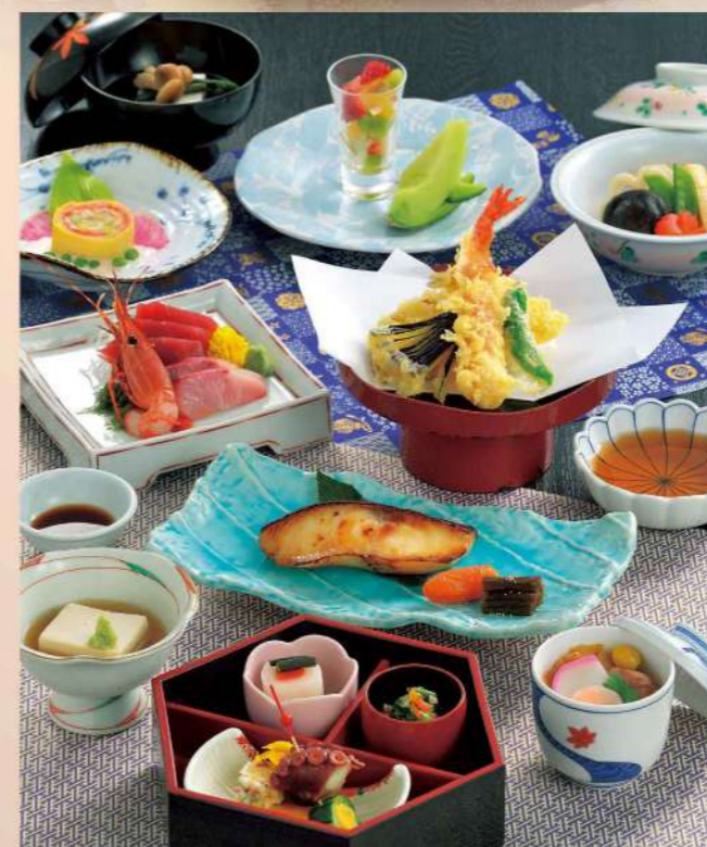
16G01 会席料理「雪」 7,350円(税込7,938円)