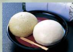
16Z41 上用まんじゅう(箱入り) 600円(税込648円)

ご法要などの 仏事のお返しに ご返礼にご利用いただける その他商品のパンフレットも ご用意しております。