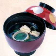
16T05 お吸物 250円(税込270円)