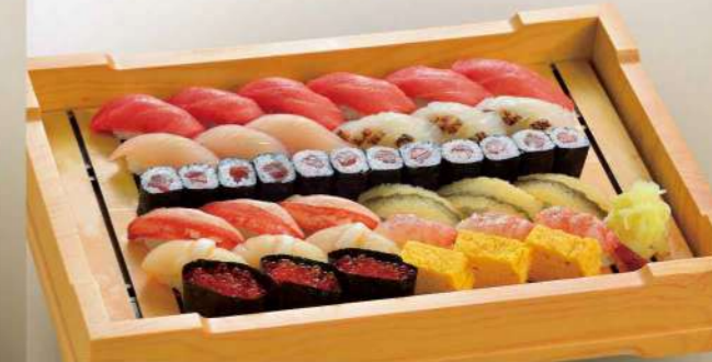
16S02 (30×42cm) 上江戸前寿司 10,500円(税込11,340円)