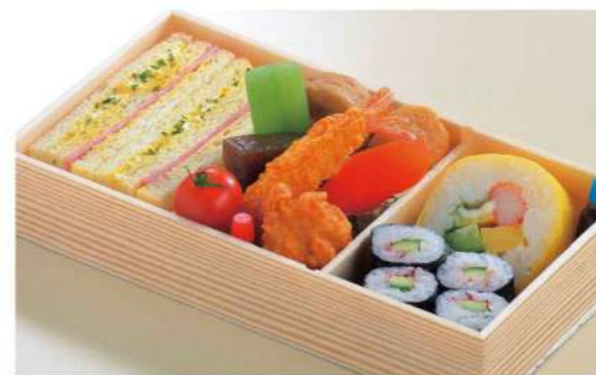
16P02 (11.5×21.5cm) サンド巻ずし料理 950円(税込1,026円)