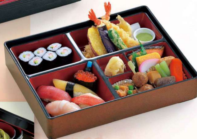
16R07 (25×31cm) 寿司料理弁当 2,300円(税込2,484円)