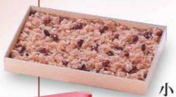
16F11 赤飯折と酒のセット 1,250円(税込1,375円) ※アルコール類の消費税率は10%になります