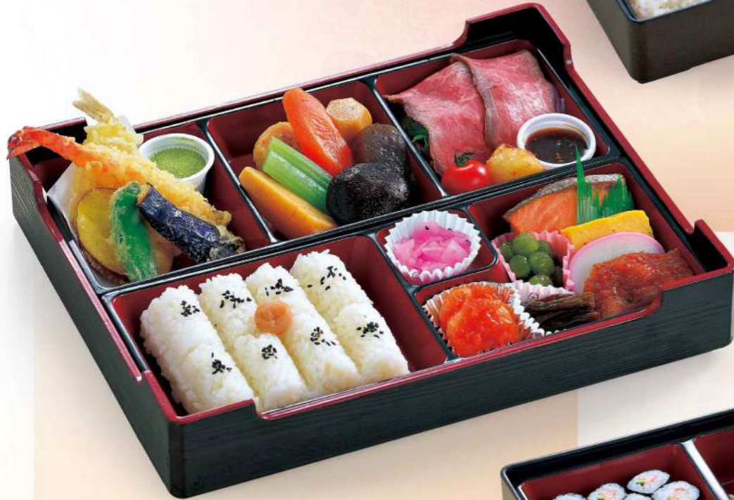
16R06 (25.5×31.5cm) あやどり弁当 2,300円(税込2,484円)