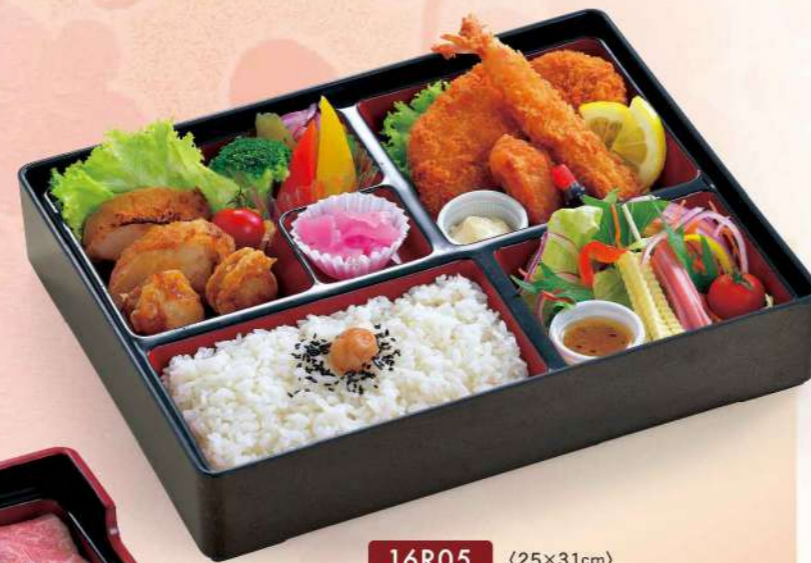
16R05 (25×31cm) 洋風弁当 1,550円(税込1,674円)

形にとらわれることなく ポリユーム感あるおいしきで どなたにも満足していただけるお弁当です。 会議などのビジネスシーンはもちろん ご会合の席でもご利用いただけます。