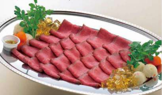
16S16 (31.3×46cm) コールドビーフ 8,400円(税込9,072円)