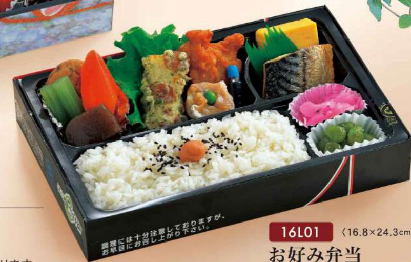
16L01 (16.8×24.3cm) お好み弁当 950円(税込1,026円)