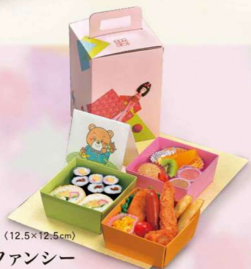
16Y02 (12.5×12.5cm) お子様ファンシー 2,000円(税込2,160円)