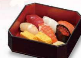
16T06 江戸前にぎり寿司・松 1,250円(税込1,350円)