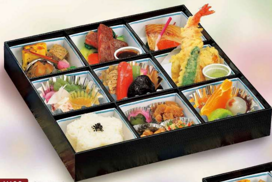
16H02 (30×30cm) 四季弁当・のどか 5,400円(税込5,832円)