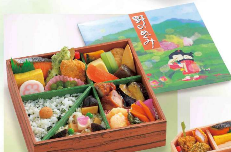
16J04 (20.2×20.2cm) 野のめぐみ 1,450円(税込1,566円)