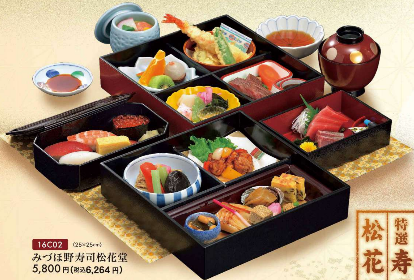
16C02 (25×25cm) みづほ野寿司松花堂 5,800円(税込6,264円)

日本の繊細な感性に、新しい感覚を織り交ぜた 素材のもつ豊かな味わいをお楽しみいただけます。