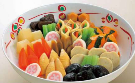
16S06 (直径 33cm) 煮物盛込み 5,750円(税込6,210円)