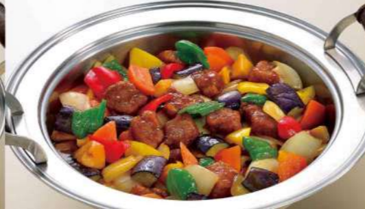
16S09 (直径 40.5cm) 五目黒酢炒め 5,750円(税込6,210円)