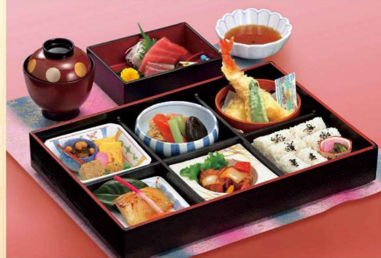
16A01 (26.5×36cm) 松花堂・松 3,900円(税込4,212円)