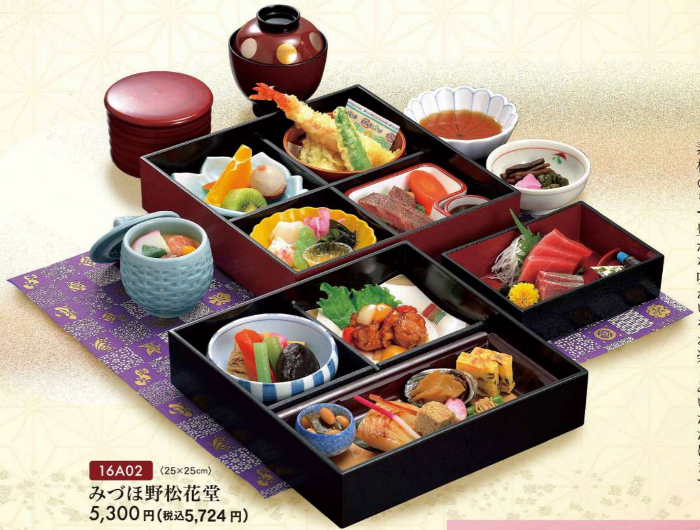
16A02 (25×25cm) みづほ野松花堂 5,300円(税込5,724円)