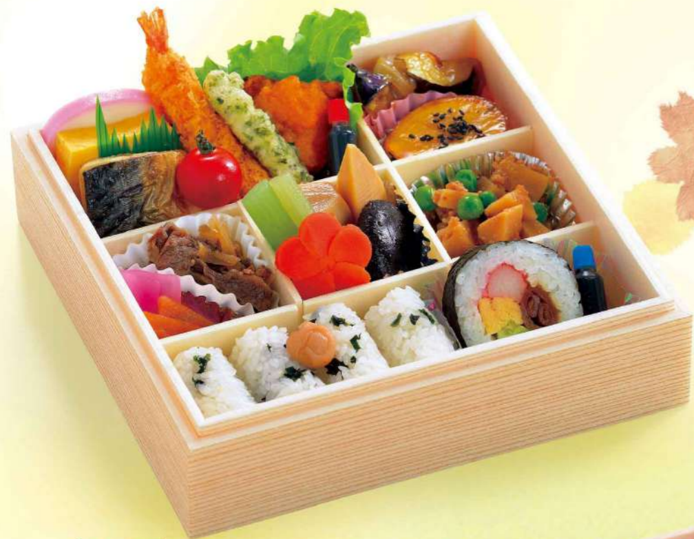
16M01 (20.6×20.6cm) 花あかり 2,600円(税込2,808円)