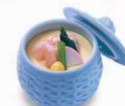
16T04 茶碗蒸し 450円(税込486円)