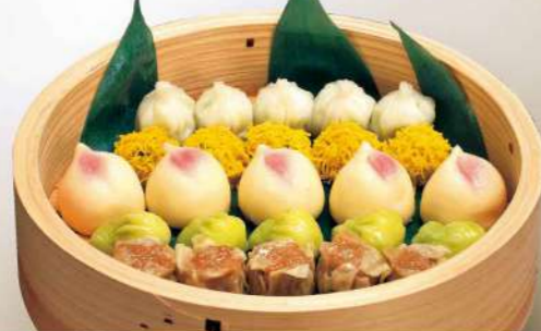
16S12 (直径 30cm) 点心盛込み (10月～3月) 5,750円(税込6,210円)