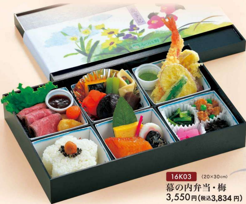
16K03 (20×30cm) 幕の内弁当・梅 3,550円(税込3,834円)

もともとお芝居の幕間に食べられたお弁当。四季の可憐な花々にあしらわれた化粧箱でお届けする色どり様々な味覚。