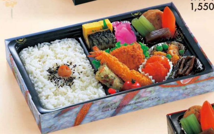
16L02 (18.3×27.6cm) お好み弁当 1,050円(税込1,134円)