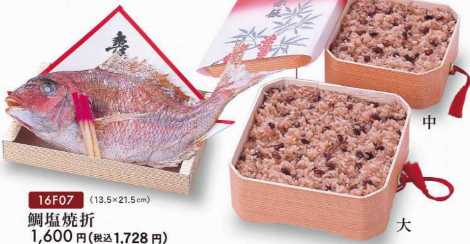
16F07 (13.5×21.5cm) 鯛塩焼折 1,600円(税込1,728円)