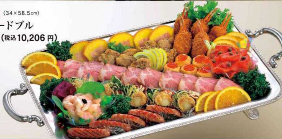
16S15 (34×58.5cm) 洋風オードブル 9,450円(税込10,206円)