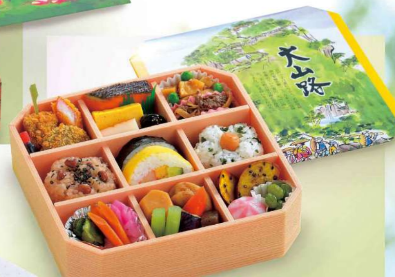
16J02 (21.7×21.7cm) おおやまじ 大山路 2,050円(税込2,214円)