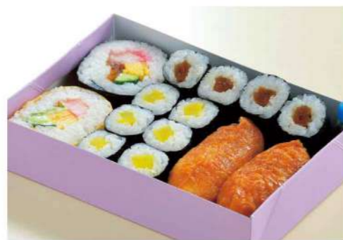
16P04 (12×17.5cm) 助六ずし 800円(税込864円)