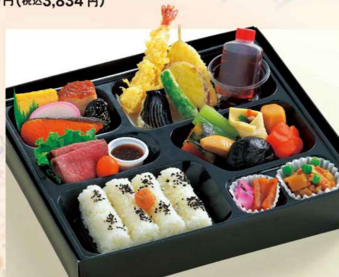
16K02 (27.1×30.2cm) 幕の内弁当・竹 2,650円(税込2,862円)