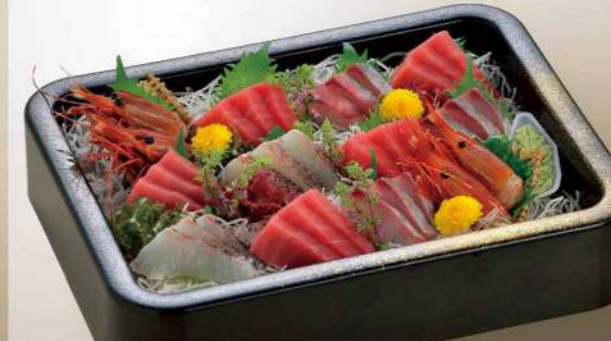
16S14 (25.7×33.3cm) 刺身盛込み 10,500円(税込11,340円)