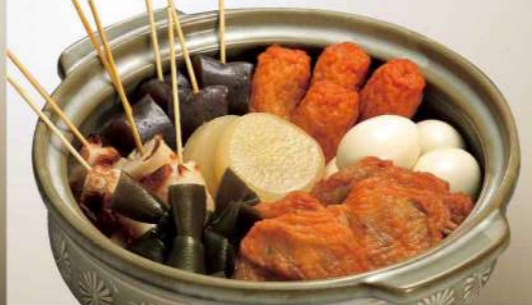
16S07 (直径 28cm) おでん (10月～3月) 4,400円(税込4,752円)