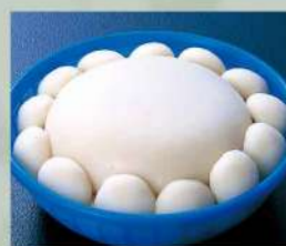
16Z38 四十九日餅 4,600円(税込4,968円)

ご法要などの 仏事のお返しに ご返礼にご利用いただける その他商品のパンフレットも ご用意しております。