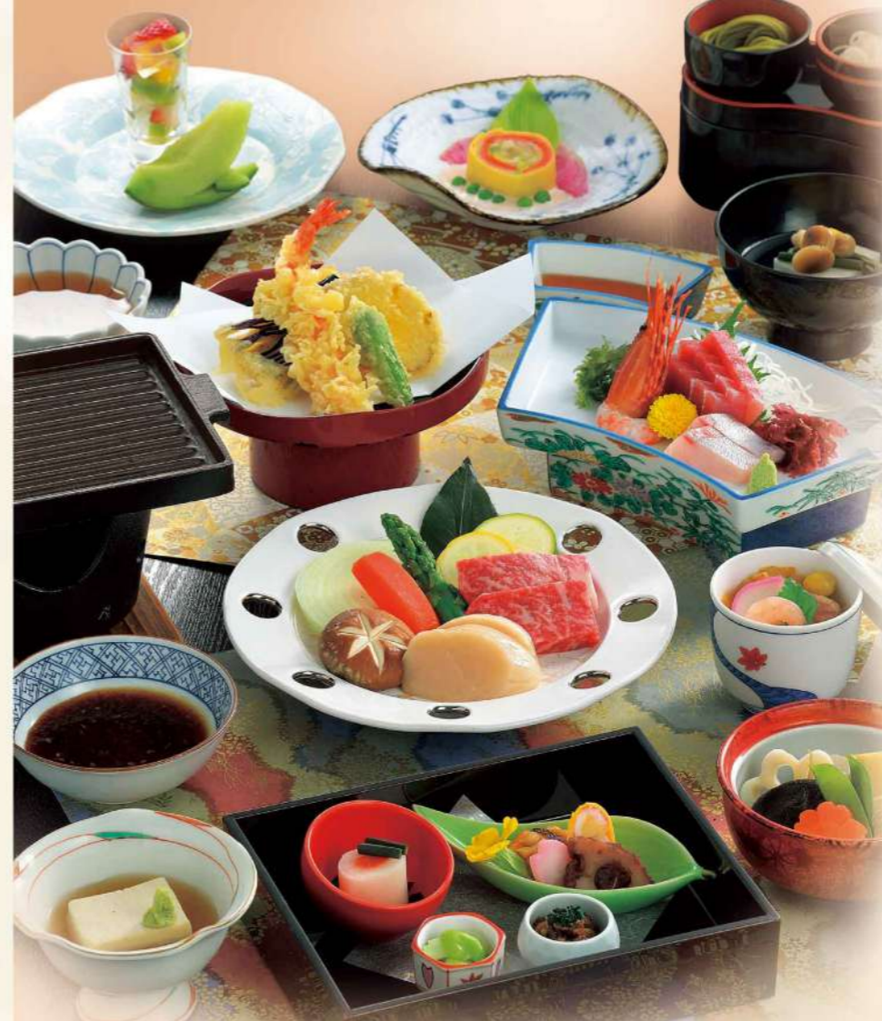
16G02 会席料理「月」 9,200円(税込9,936円)

大切な方々をお招きする あらたまったお席を吟味を尽くし 選び抜いた味覚で満たす会席料理。 和やかに語り過ごすひと時を 見事に演出いたします。