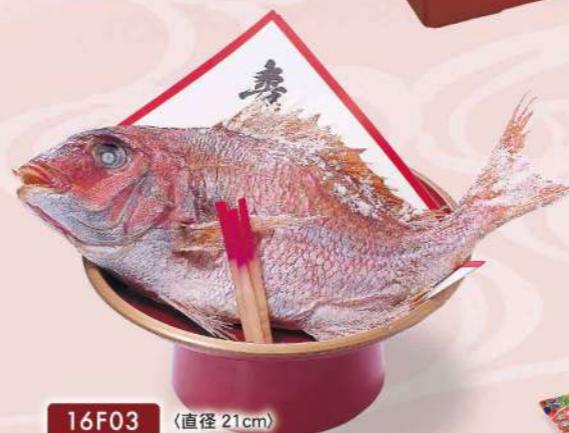
16F03 (直径 21cm) 祝い鯛姿塩焼 1,600円(税込1,728円)