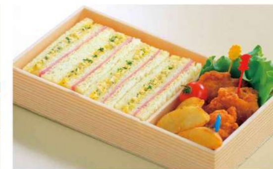
16P01 (11.5×21.5cm) から揚げサンドイッチ 950円(税込1,026円)