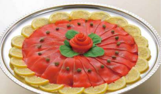
16S17 (直径 40.5cm) スモークサーモン 6,800円(税込7,344円)