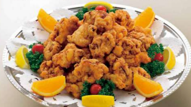
16S21 (直径 35.5cm) 若鶏のから揚げ 4,400円(税込4,752円)