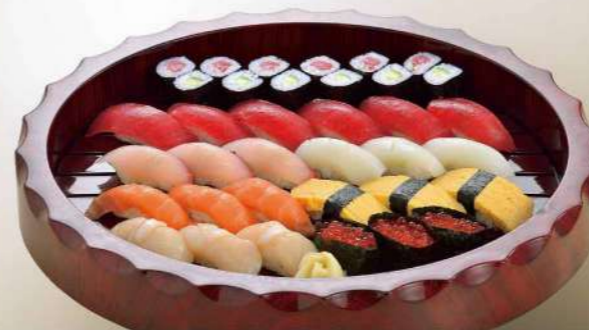
16S01 (36.5×43cm) 江戸前寿司 5,750円(税込6,210円)