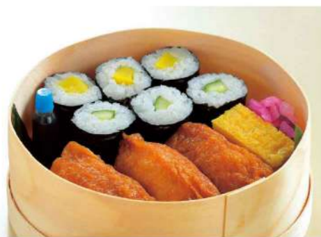
16P05 (直径 14cm) ひめずし 850円(税込918円)