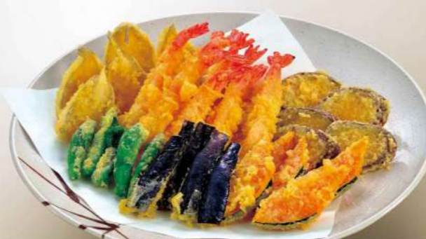
16S05 (直径 36cm) 天婦羅盛込み 5,450円(税込5,886円)