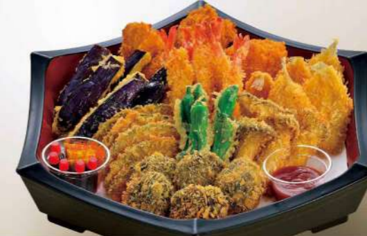
16S22 (32.5×28.3cm) フライ盛込み 5,450円(税込5,886円)