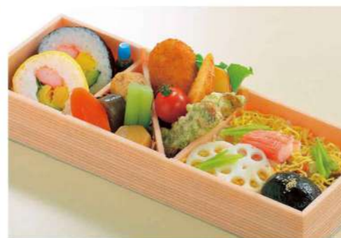
16P03 (10×26.8cm) 太巻ちらし料理 1,050円(税込1,134円)